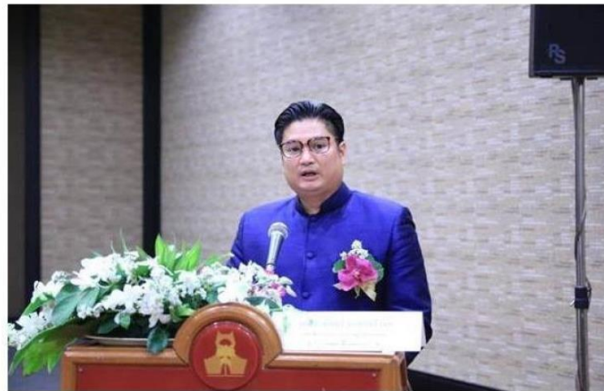
กรุงเทพฯ--25 ก.พ.--สำนักงานเศรษฐกิจการเกษตร

ข่าวประชาสัมพันธ์ทั่วไป Tuesday February 25, 2020 15:04